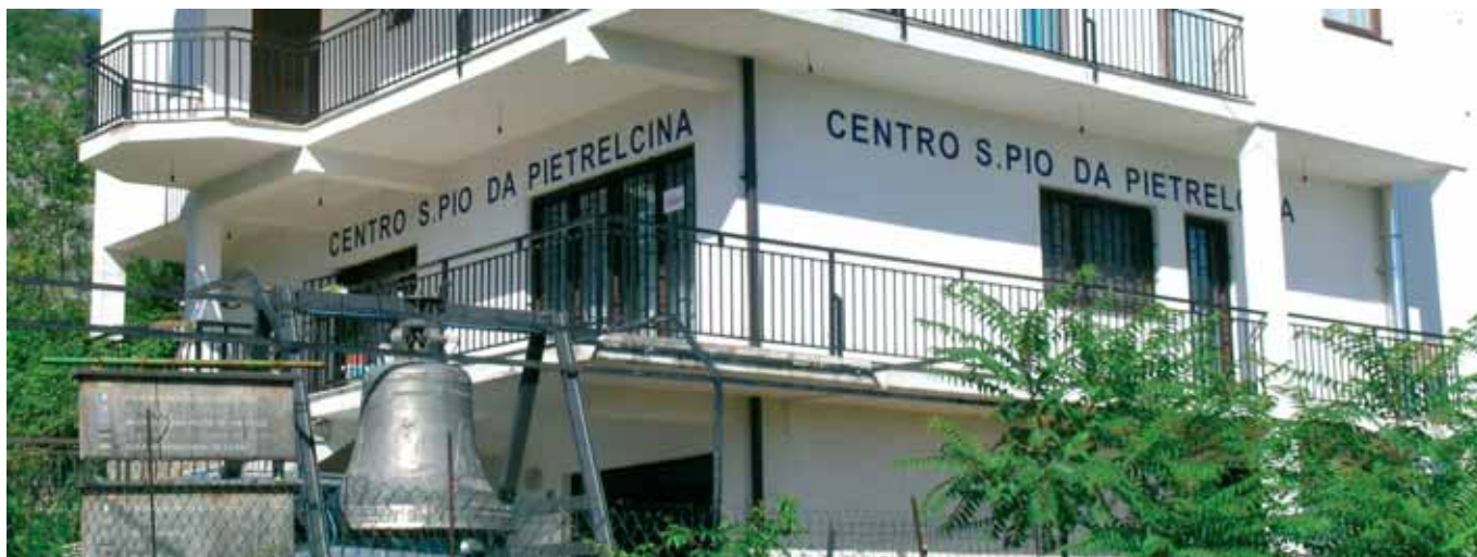
1) Il Centro San Pio da Pietrelcina - Casa Internazionale della Pace a Medjugorje in via Cilici ove hanno sede gli ambulatori temporanei; in primo piano la grande Campana della Pace (18 quintali di bronzo) simbolo della nostra Associazione Ente Morale.

Un viaggio nella capitale della Bosnia ed Erzegovina era stato infatti organizzato per l'8 Settembre 1994, ma l'assenza di adeguate