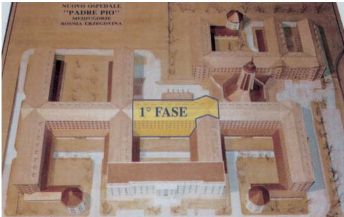
3) Modello del progetto generale esposto a Medjugorje, via Cilici, presso il Centro San Pio da Pietrelcina. In giallo la Prima Fase - Dipartimento materno Infantile.